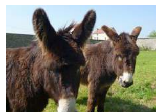
Ménélas et Toto

On propose aussi aux enfants une promenade à dos d'âne !